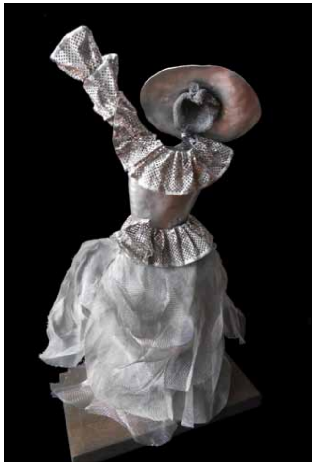
Brisas de Paños. Bullerengue 57 x 20 x 29 cm Chapa Batida, Aluminio Reciclado, Malla Metálica y Alambre 2017