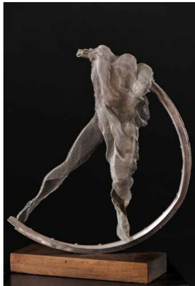
Pág. Anterior: Descanso Mecido 49 x 39 x 15 cm Chapa Batida, Rin de Bicicleta y Malla Metálica 2015