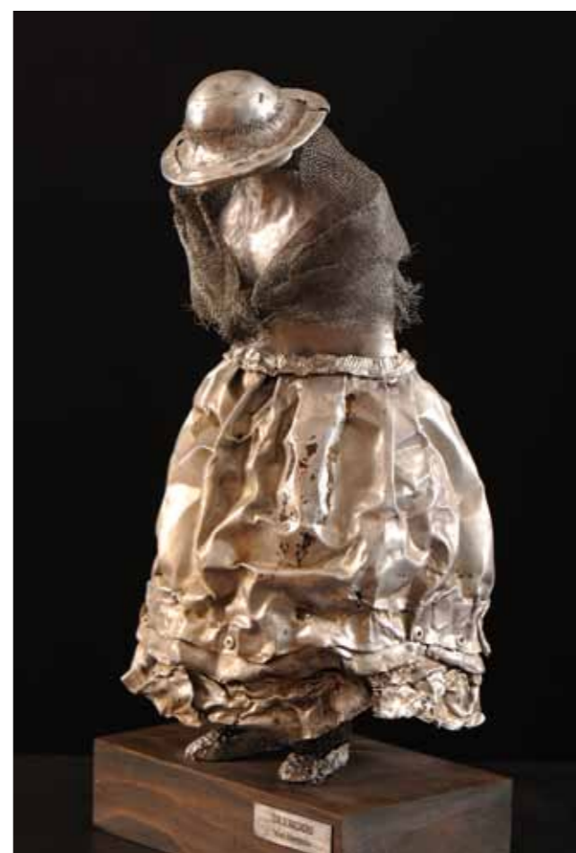
Silencios 33 x 19 x 17 cm Chapa Batida, Alambre y Malla Metálica 2014