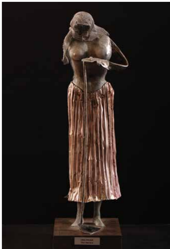
Pág. Anterior: Ecos Ancestrales 36 x 20 x 18 cm Aluminio Reciclado, Alambre y Malla Metálica 2016