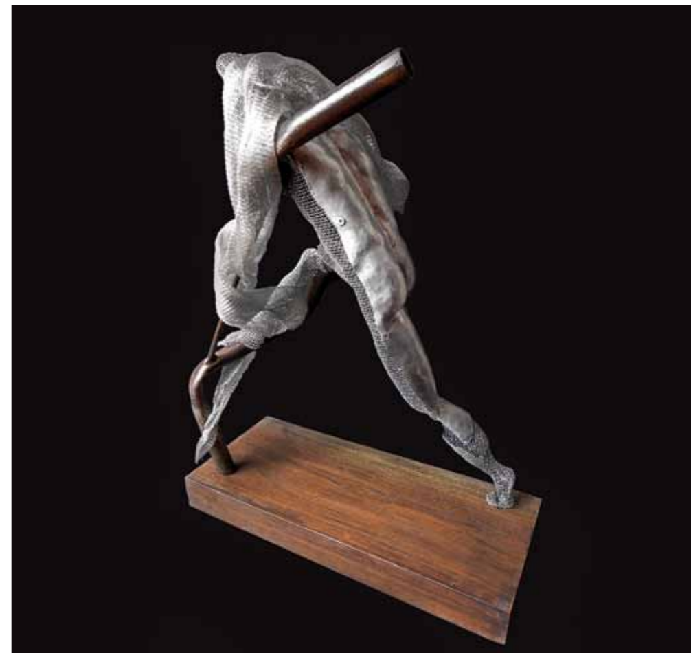
Entrelazos 46 x 25 x 35 cm Chapa Batida, Malla Metálica, Alambre y Objeto de Hierro 2017