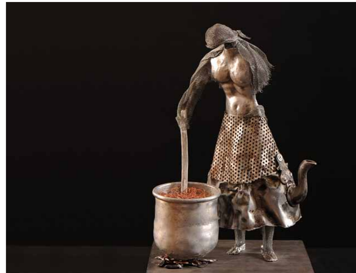
Dulce Bermellón 40 x 26 x 22 Chapa Batida, Aluminio, Malla Metálica e Hilos de Cobre 2016