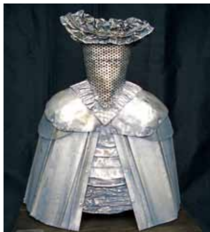
Juana Menina 45 x 21.5 x 36 cm Aluminio Reciclado 2010