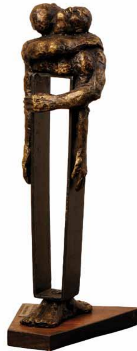
Nuestro Mundo 32 x 14 x 11 cm Bronce Fundido y Hierro 2007