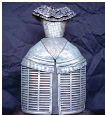
Laura Menina 38 x 25 x 14 cm Aluminio Reciclado 2010