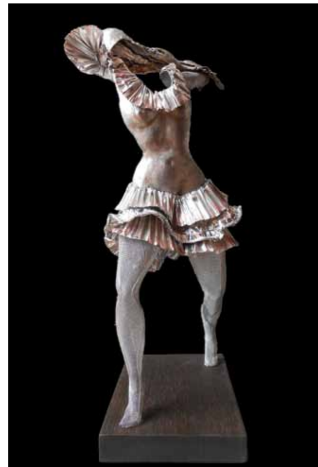
Rítmicos Alocados. Joropo 48 x 16 x 14 cm Chapa Batida, Aluminio Reciclado, Malla Metálica y Alambre 2017