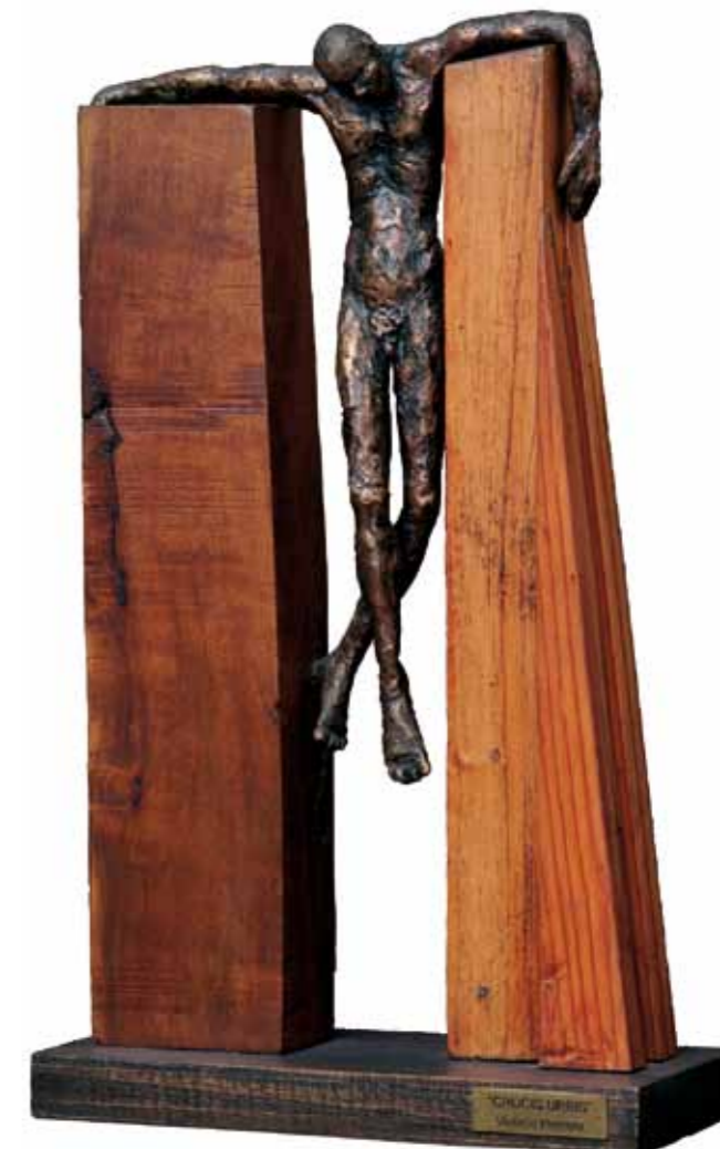
Crucis Urbis 40 x 21 x 6 cm Bronce Fundido y Madera 2005

Los seres que habitan estos bronce son de cualquier lugar, o mejor aún del no lugar. Los vemos por doquier y reflejan el medio social y físico que traza el sentido de sus vidas. Allí donde existir es un desafío: la vida misma en su dimensión material y espiritual. Un mundo de indiferencia, soledad y desencanto.