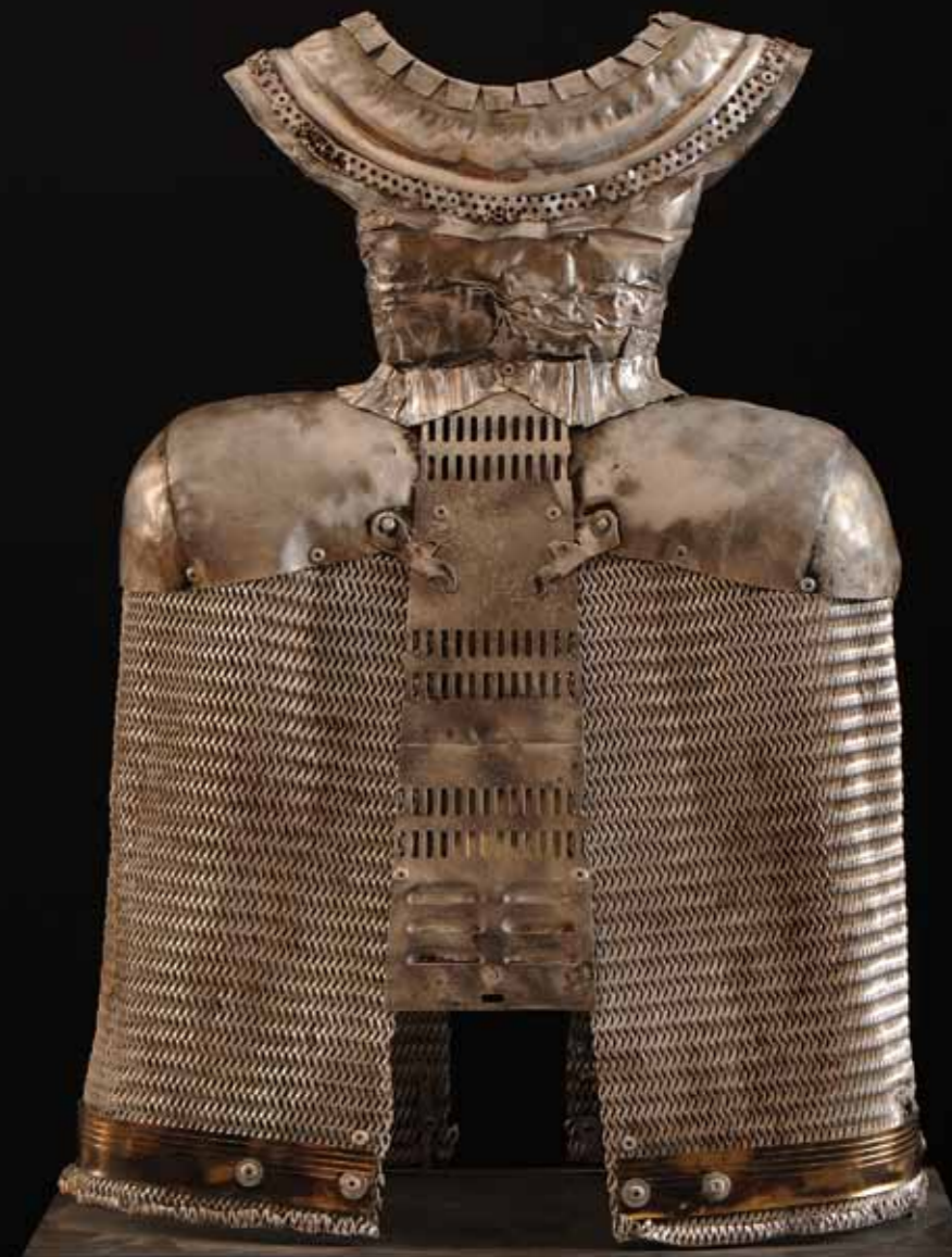
Camila Menina 57 x 40 x 21 cm Aluminio Reciclado y Cobre 2016

«un ejército de jóvenes muchachas que están allí para bailar este divino alboroto parisino, como su reputación lo exige [...] con una elasticidad cuando lanzan su pierna en el aire que nos deja predecir una flexibilidad moral al menos igual.»