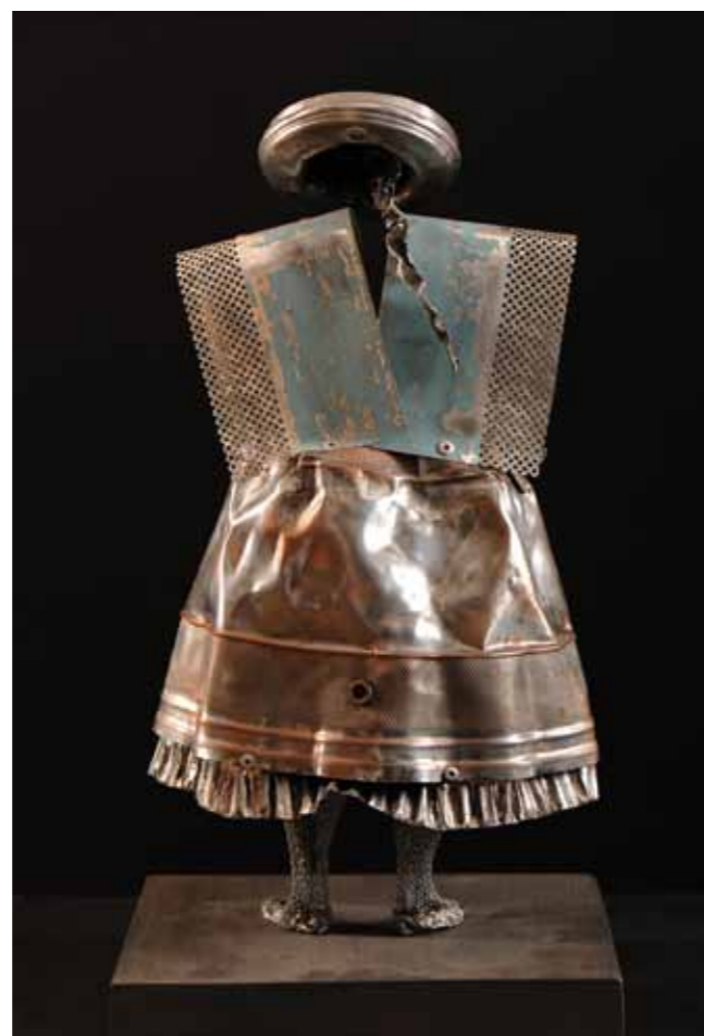
Pág. Anterior: Íntimo Silencio 42 x 22 x 20 cm Aluminio Reciclado, Alambre y Malla Metálica 2016